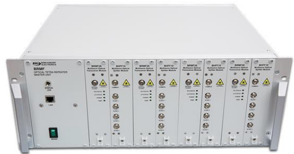
Optische Master-Unit BRMF63 mit 16 optischen Schnittstellen (neue Ausführung mit SC-APC-Verbindern)

Höchste Flexibilität bietet die OMU BRMF63 in zwei Ausbaustufen. Eine Variante bietet 8, 12 oder 16 optische Schnittstellen, die erweiterte Ausführung bis zu 32 optische Schnittstellen (in 4er-Schritten). Der parallele Einsatz zweier OMU ermöglicht eine OMU-Redundanz und erhöht die Anzahl der optischen Schnittstellen. Damit können auch sehr große Objekte versorgt werden.