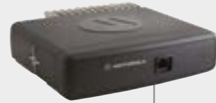
IP67-MONTAGE BOOT, MOTORRAD