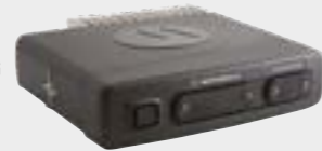
VERBESSERTER ERWEITERUNGSKOPF STANDARD-UND ZUSATZANSCHLUSS 25-POLIG UND RS232