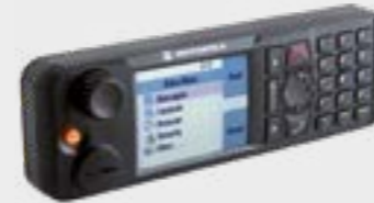
ETHERNET-REMOTE-BEDIENTEIL (RECH) UNTERSTÜTZT EXTERNE LAUTSPRECHER UND SPRECHTASTE