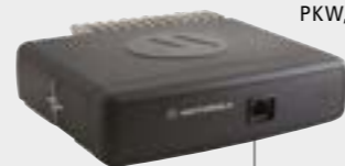
MONTAGE MIT ABGESETZTEM BEDIENTEIL PKW, RETTUNGSWAGEN, LÖSCHFAHRZEUG