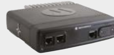
ETHERNET-ERWEITERUNGSKOPF 2X ETHERNET-STD, ETHERNET-SIM-LESEGERÄT UND RS232