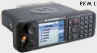
ARMATURENBRETT PKW, LKW